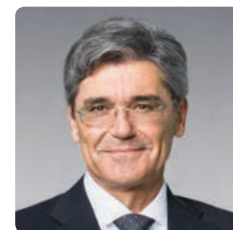
Joe Kaeser Vorsitzender des Vorstands der Siemens AG